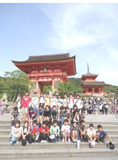
【清水寺仁王門(目隠し門)にて】