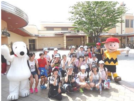
【スヌーピーとチャーリーブラウン】