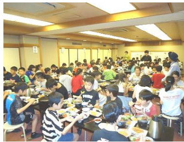
【旅館での食事風景】