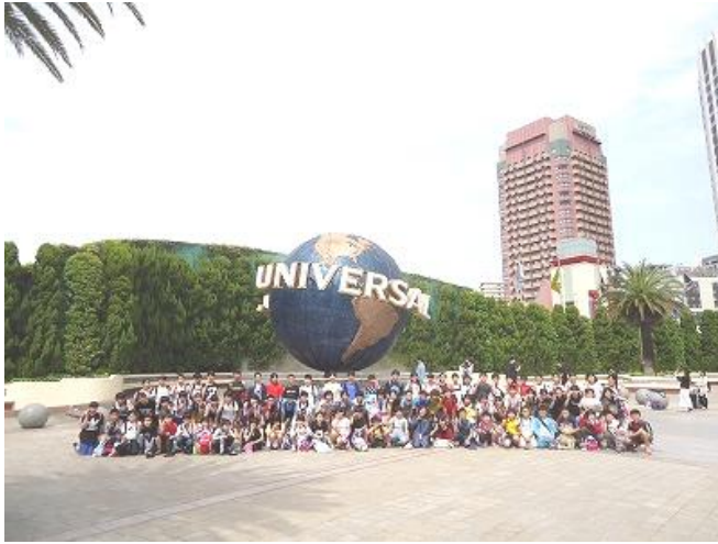
【ユニバーサルスタジオジャパンにて全員集合】

ました。金閣寺では、金色に輝く建物に驚きの声が上がっていました。また、清水寺では、弁慶の杖を持ち上げようとしたり、全員が音羽の滝の水（健康長寿、美男美女、頭脳明晰のいずれか）を飲んだりしていま